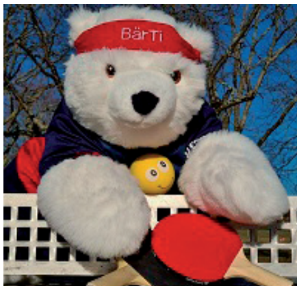
In Renningen beliebt: Maskottchen BärTi